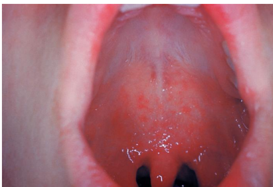
Afbeelding 2 Voorbeeld van Koplik spots 6