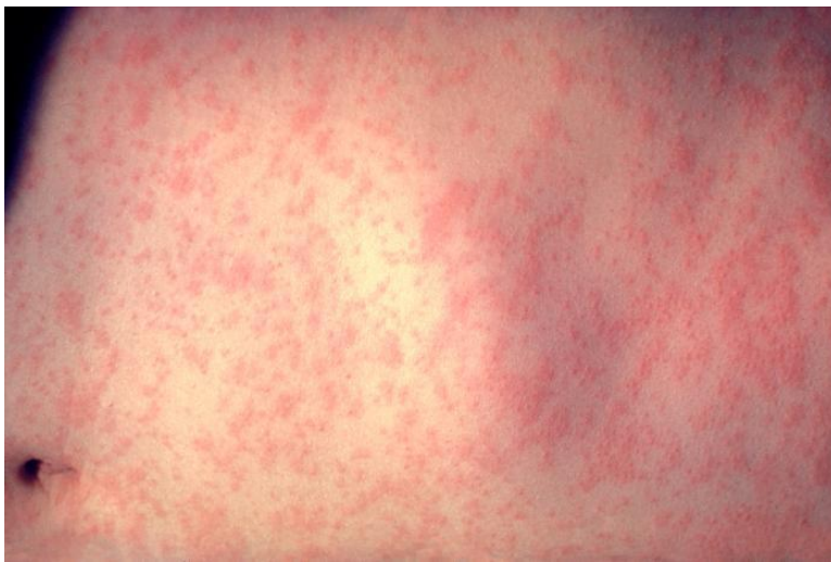
Afbeelding 3: Mazelen eruptie 3 dagen na begin van mazeleninfectie 8

patiënten met een ernstige mazelen een gegeneraliseerde lymfadenopathie en splenomegalie ontwikkelen 7 . In totaal duurt de exanthemateuze fase meestal 7-10 dagen.